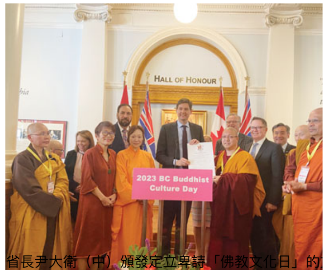
省長尹大衛(中)頒發定立卑詩「佛教文化日」的文告

來自15個族裔、30多個佛教團體的300多名高僧、法師及信眾昨日齊聚卑詩首府維多利亞，在省議會大樓內見證卑詩佛教文化日的誕生。